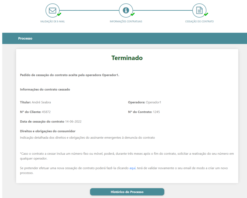
Figura 12 - Processo: Resposta da Operadora ao Pedido de Cessação do Contrato