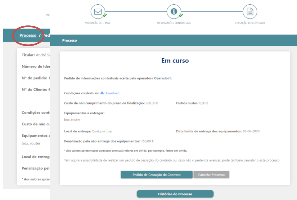
Figura 9 - Processo: Pedido de Informações Contratuais

Poderá a qualquer momento consultar o seu processo acedendo a todas as informações e histórico de etapas relativas ao mesmo.