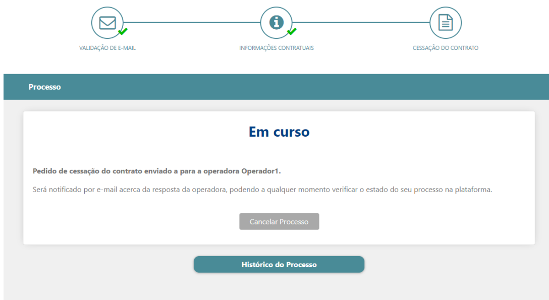
Figura 11 - Processo: Pedido de Cessação do Contrato